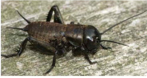
Рисунок 6 – Степной сверчок