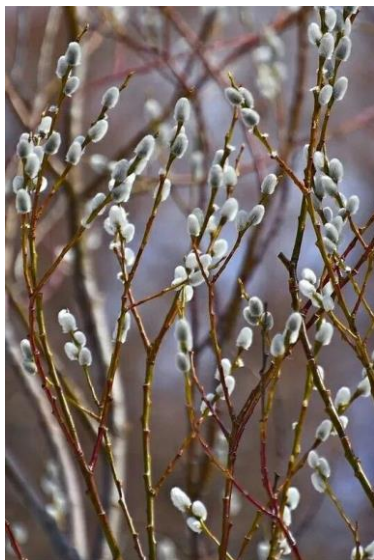
Рисунок 1 – Верба

Рассмотрим другие случаи. Например, лексема «бурьян», представленная в тексте, определяется словарем как «сорные травы, преимущественно высокие, крупностебельные (крапива, лопух, чертополох и т.п.)» [4]. Данная лексическая единица была переведена в обоих случаях при помощи описательного перевода «coarse steppe grass», что, на наш взгляд, позволяет максимально точно передать значение оригинала. Однако для ее обозначения также использовался вариант «weed», который, как нам кажется, не позволяет точно передать смысл исходного слова, так как «бурьян» означает «высокие сорные травы», а «weed» в большинстве случаев переводится как «сорная трава» [14]. Рассмотрим еще один пример, лексему «верба». В предложенных переводах она была генерализирована словом «willow», что означает «ива». Как известно, верба происходит из семейства ивовых, тем не менее, внешне они отличаются. Поэтому такой перевод вызывает вопрос, так как не позволяет читателю визуализировать передаваемую автором оригинала картину. Возможно, варианты «pussy-willow» или «white willow» были бы более точными [12].