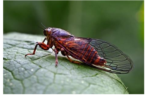
Рисунок 7 – Цикада

Термин «бобырик» означает мелкую сорную рыбу, в обоих переводах он был передан целостной заменой «chub», которая дословно означает вид рыбы «голавль» [5; 17]. Данное преобразование можно объяснить тем, что переводчики недостаточно ознакомились с регионализмами. Однако местное название окуня «чикамас» оба переводчика передали верно.