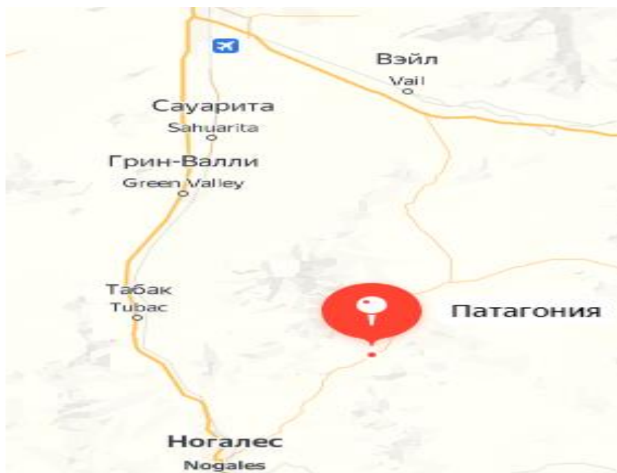
Рисунок 1 – Пампасы Южной Америки на карте мира

Степные области Патагонии, известные своими широкими пространствами, густым травостоем и уникальной флорой и фауной, сформировались вследствие предшествующих климатических изменений. Долгие периоды засухи и жары, а также ветровые системы, обусловленные наличием океана и примыкающих к Патагонии гор, имеют существенное влияние на формирование и поддержание степных экосистем в этом регионе [5].