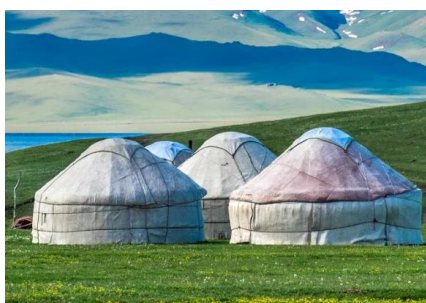
Рисунок 2 – Южный Казахстан. Лексические единицы: юрта, стоянка, кочевники