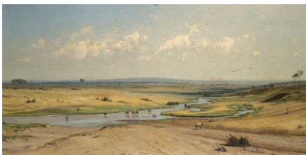
Рисунок 3 – Картина «Степь» русского живописца Владимира Орловского (1842-1914). Лексические единицы: табун, пасти, пастух, водопой

После этого преподаватель просит студентов сравнить степь с другими природными зонами, такими как тундра, тайга, пустыня и так далее. Это поможет китайским обучающимся лучше понять уникальные характеристики степи и то, как она отличается от других природно-климатических зон.