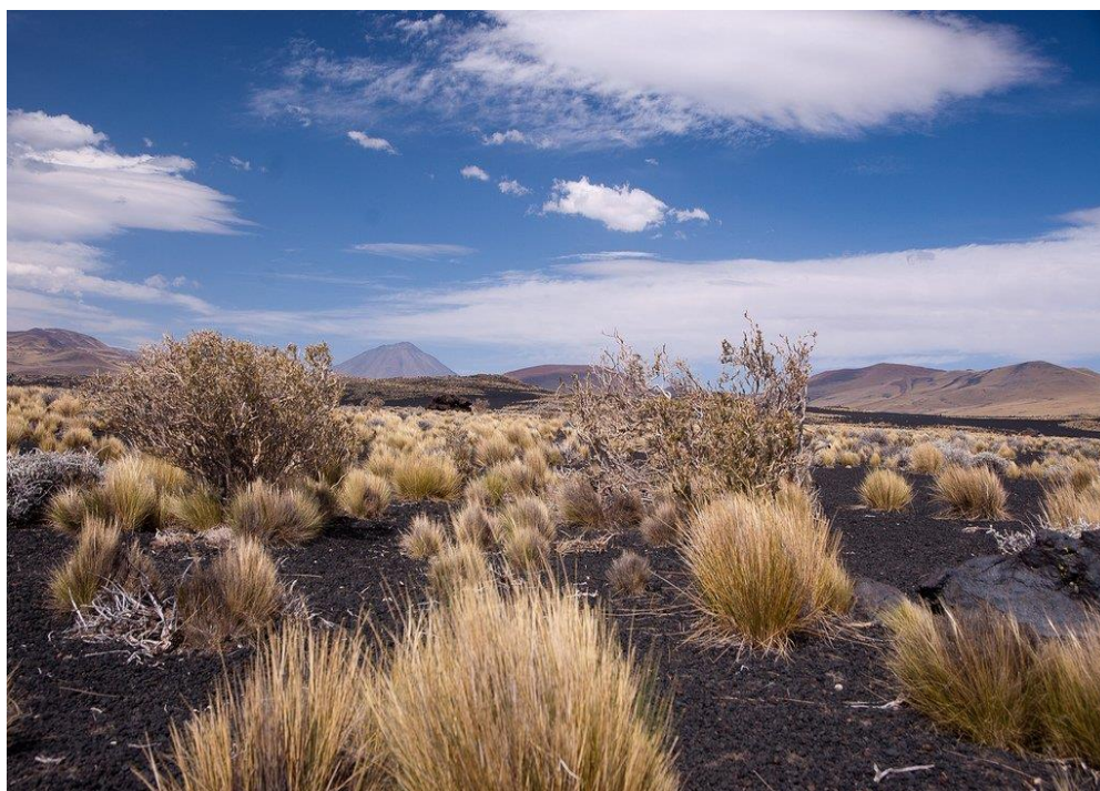
Рисунок 2 – Степь Пампа (Аргентина)

Промышленные производства на территории Патагонии смещают природные балансы, влияют на растительный и животный мир, а также приводят к изменению климатических условий в регионе. Вырубка лесов, загрязнение рек и озер, выбросы токсичных веществ в атмосферу – все эти факторы оказывают негативное влияние на степную зону Патагонии, вносят дисбаланс в экологическую систему и угрожают ее сохранению [6].