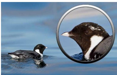
Рисунок 3 – Старичок