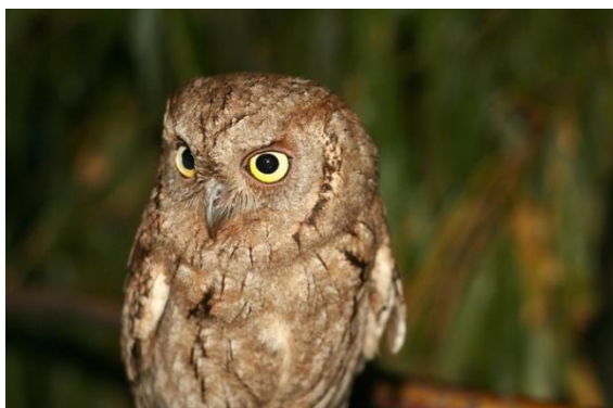
Рисунок 5 – Сплюшка

А птицу «стрепет» передали генерализацией, так как «bustard» означает семейство дрофиных птиц, к которому относится стрепет [14]. «Ворон» и «серая ворона» – разные виды одного семейства птиц, однако в английском языке для обоих терминов используется слово «crow», таким образом, переводчики произведения использовали данный эквивалент, приближенный к оригиналу [6]. Стоит обратить внимание также на лексему «сплюк», или «сплюшка», которую перевели калькированием «sleeper». На наш взгляд, данный эквивалент не в полной мере передает термин, так как «сплюк» означает редкий вид сов, обитающий как в степных районах, так и в лесах на территории России от Западной Европы до Восточной Сибири. В произведении А. П. Чехова говорится о том, что птица названа так жителями степи из-за звуков, которые она издает, напоминающие «Сплю! сплю! сплю!». На английский язык переводчики дословно перевели данную имитацию, как «I'm sleeping, I'm sleeping, I'm sleeping!» и «sleep, sleep, sleep». Таким образом, название, появившееся в русском языке в результате ономотопеи, в работе переводчиков было искажено. На наш взгляд, при переводе можно было прибегнуть к транслитерации с добавлением переводческого комментария.