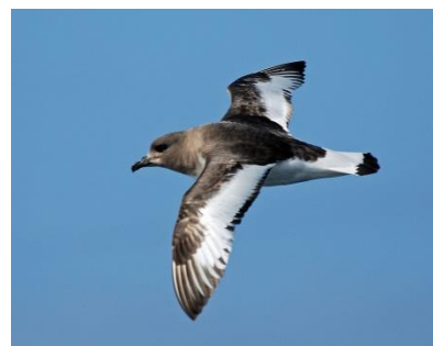
Рисунок 4 – Антарктический буревестник

А птицу «стрепет» передали генерализацией, так как «bustard» означает семейство дрофиных птиц, к которому относится стрепет [14]. «Ворон» и «серая ворона» – разные виды одного семейства птиц, однако в английском языке для обоих терминов используется слово «crow», таким образом, переводчики произведения использовали данный эквивалент, приближенный к оригиналу [6]. Стоит обратить внимание также на лексему «сплюк», или «сплюшка», которую перевели калькированием «sleeper». На наш взгляд, данный эквивалент не в полной мере передает термин, так как «сплюк» означает редкий вид сов, обитающий как в степных районах, так и в лесах на территории России от Западной Европы до Восточной Сибири. В произведении А. П. Чехова говорится о том, что птица названа так жителями степи из-за звуков, которые она издает, напоминающие «Сплю! сплю! сплю!». На английский язык переводчики дословно перевели данную имитацию, как «I'm sleeping, I'm sleeping, I'm sleeping!» и «sleep, sleep, sleep». Таким образом, название, появившееся в русском языке в результате ономотопеи, в работе переводчиков было искажено. На наш взгляд, при переводе можно было прибегнуть к транслитерации с добавлением переводческого комментария.